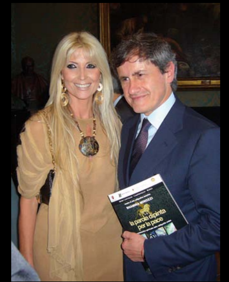
Campidoglio, Roma - Maggio 2012 - Il sindaco do Roma Gianni Alemanno presenta alla stampa l'evento artistico.